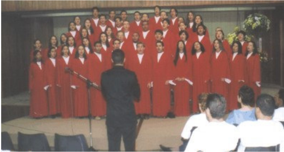
O Coral Carlos Gomes cantou louvores de salvação!

Nestes momentos fraternos cresce a valorização daquilo que nos une muito mais do que aquilo que nos divide. E quando formarmos uma unidade, estaremos cumprindo o que Jesus pediu ao Pai: Que sejamos uma unidade, uma coisa só.